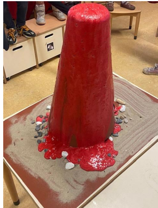
Een vulkaanuitbarsting in de groep!