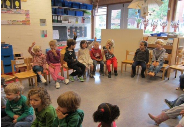
In de kring

In de kring openen we de dag met een liedje. We kijken welke dag het vandaag is, wat voor weer het is en hoe de dag er uit gaat zien aan de hand van de dagplanningskaarten. Vervolgens praten we over het weekend of doen we op een speelse manier iets met taal of rekenen, we zingen liedjes, doen proefjes, spelletjes, lezen interactief voor enzovoorts. De inhoud van de kring stemmen we af op het lopende thema of project. Wereldoriëntatie is het hart van ons onderwijs, we werken daarom altijd met thema's.